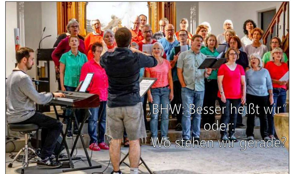
BHW in Aktion: Bommern und Herbede singen, Wengern ist an den Tasten

Liebe Gemeinden, die Überschrift: „BHW: Besser heißt wir“ stammt von unserem Thema des Sommerfestes am 30. Juni aller drei Gemeinden in Bommern. Und da schwingt schon etwas von der Richtung mit, in der wir gemeinsam unterwegs sind: Aus den drei einzelnen Gemeinden Bommern, Herbede und Wengern soll ein „Wir“ werden. Wir sind überzeugt, dass diese Zusammenarbeit langfristig der richtige und bessere Weg für eine zukunftsfähige Gemeindegemeinschaft vor Ort ist. Deshalb sind wir nach der Empfehlung der Kreissynode im letzten Herbst, auf dem Weg eine Fusion der Gemeinden zum 01. Januar 2026 vorzubereiten.