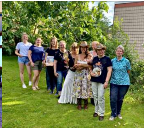
Willkommensfeier für das jüngste Mitglied im MZ

So begrüßen sich die Lucky Feet Linedancer und bringen seit Mai jeden Donnerstagabend im Markus-Zentrum ihre Cowboyboots beim Tanzen zu Countrymusik zum Qualmen. Frisch gegründet wurde die Gruppe im November letzten Jahres in Durchholz und der Auftakt in der Schöpfungskirche war ein voller Erfolg ebenso wie der erste Countryabend, der im April noch dort in geselliger Runde und natürlich zum gemeinsamen Linedance stattgefunden hat. Mit einem weinenden Auge wurde zugleich gebührend Abschied von der Gründungsstätte genommen, bevor der Umzug nach Herbede erfolgte. Mittlerweile umfasst die