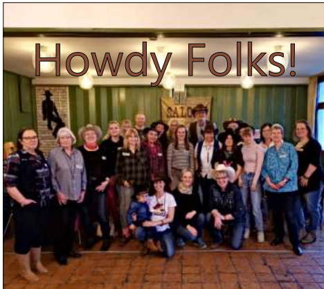
Abschiedsfeier von der Schöpfungskirche

So begrüßen sich die Lucky Feet Linedancer und bringen seit Mai jeden Donnerstagabend im Markus-Zentrum ihre Cowboyboots beim Tanzen zu Countrymusik zum Qualmen. Frisch gegründet wurde die Gruppe im November letzten Jahres in Durchholz und der Auftakt in der Schöpfungskirche war ein voller Erfolg ebenso wie der erste Countryabend, der im April noch dort in geselliger Runde und natürlich zum gemeinsamen Linedance stattgefunden hat. Mit einem weinenden Auge wurde zugleich gebührend Abschied von der Gründungsstätte genommen, bevor der Umzug nach Herbede erfolgte. Mittlerweile umfasst die