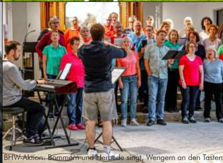
BHW-Aktion: Bommern und Herbede singt, Wengern an den Tasten